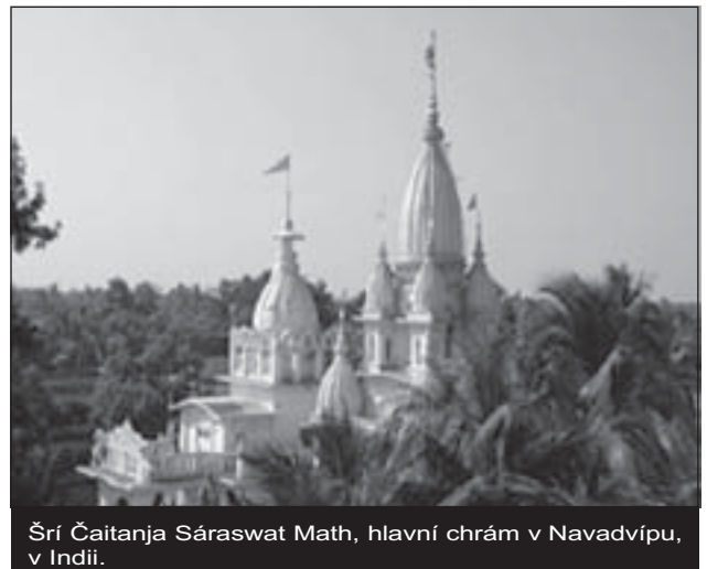
Šrí Čaitanja Sárasvat Math, hlavní chrám v Navadvípu, v Indii.

⇒ Dokončení rozhovoru na 3. straně obálky.